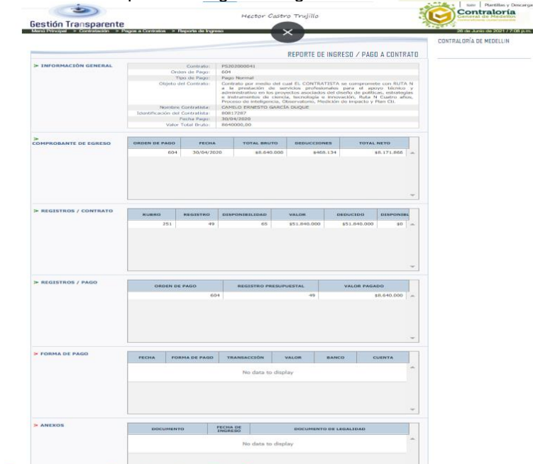
Cuadro 27. Reporte de Ingreso/Pago a Contrato PS20200041, Orden de Pago 604.

Como se ilustra en el Acta de Terminación y Liquidación del Contrato de Prestación de Servicios Profesionales N° PS20200041, no se relaciona el Comprobante de Egreso 604 de abril 30 de 2020, por valor de $8.640.000, registro que si aparece en los comprobantes de egreso reportados por el Sujeto de Control (ver línea 3 del cuadro 25), según consulta realizada en la Plataforma Gestión Transparente (Consulta de pagos) en junio 26 de 2021, ruta: Contratación>Contratos>Búsqueda de pagos>Lista de pagos (véase Cuadro 26), por lo cual existe una diferencia o excedente a favor del Contratista de $10.656.000. Como quiera que esta suma ya fue justificada, las incidencias fiscal y disciplinaria se levantan.