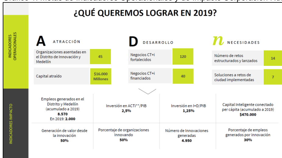
Gráfico 1. Metas de Indicadores Operacionales y de Impacto Corporación Ruta N 2019

Por su parte, los logros obtenidos por la Corporación Ruta N Medellín en el año 2019, para los ocho (8) indicadores de impacto se describen a continuación: